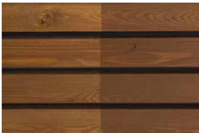
Teinte 4735 (une couche)