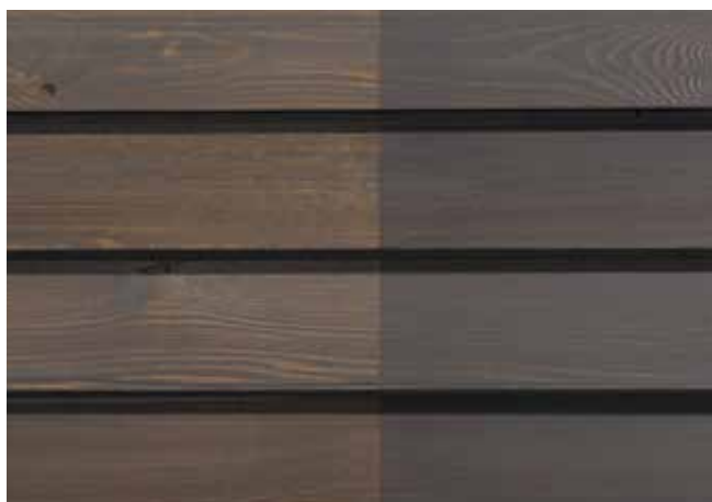
Teinte 4880 (une couche)