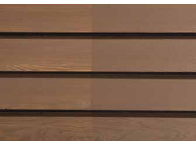
Teinte 4740-M (une couche)