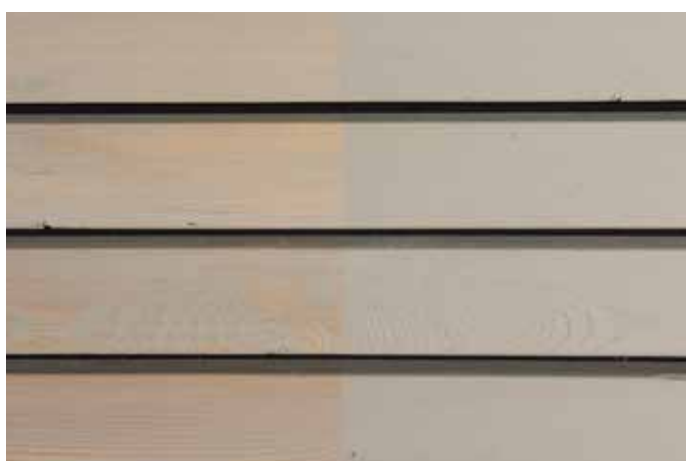
Teinte 4863-M (une couche)