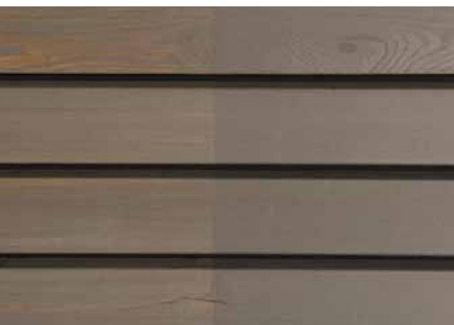
Teinte 4470-M (une couche)