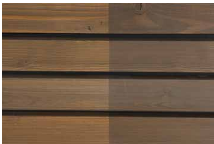
Teinte 4470 (une couche)