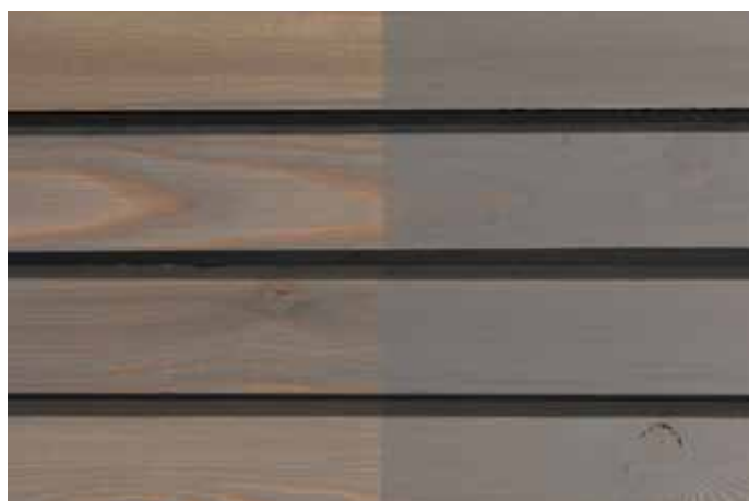
Teinte 4870 (une couche)