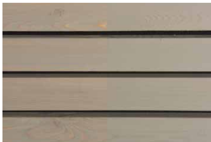
Teinte 4825-M (une couche)