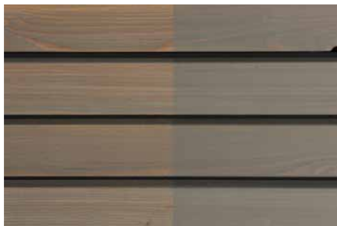
Teinte 4831 (une couche)