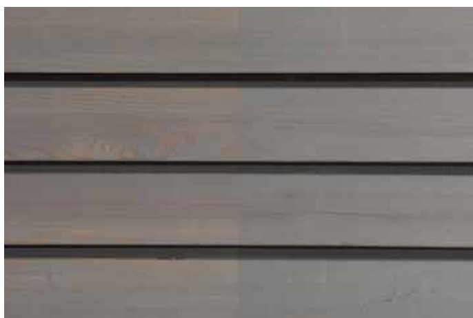
Teinte 4870-M (une couche)