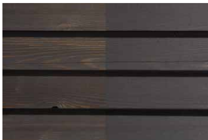
Teinte 4890-M (une couche)