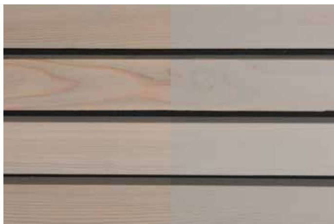
Teinte 4861 (une couche)