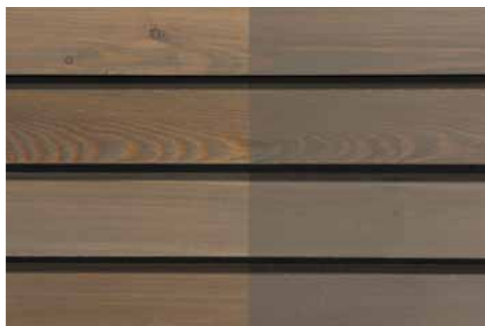
Teinte 4832 (une couche)