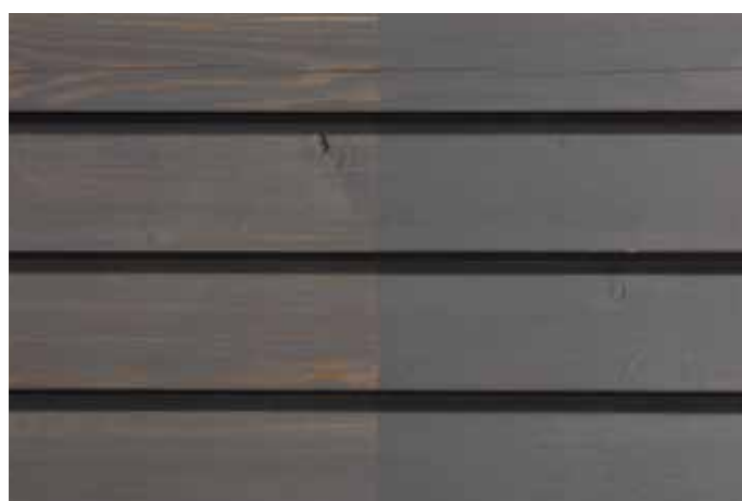
Teinte 4880-M (une couche)