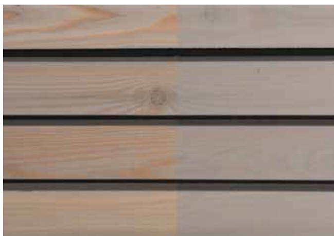
Teinte 4875 (une couche)