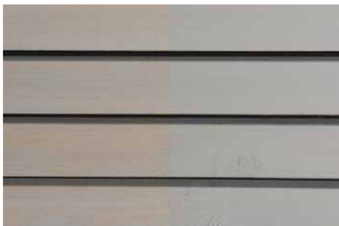
Teinte 4861-M (une couche)