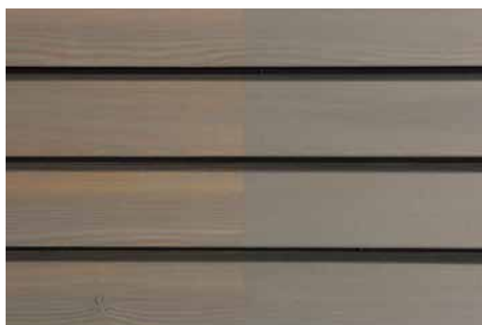
Teinte 4832-M (une couche)