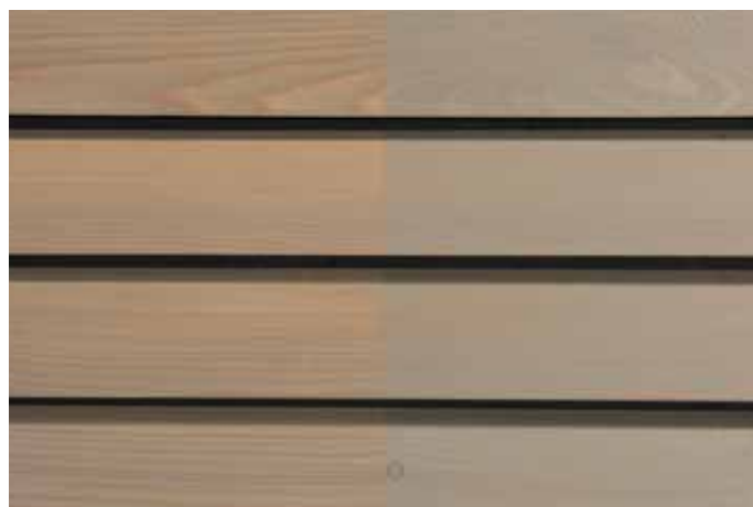
Teinte 4825 (une couche)