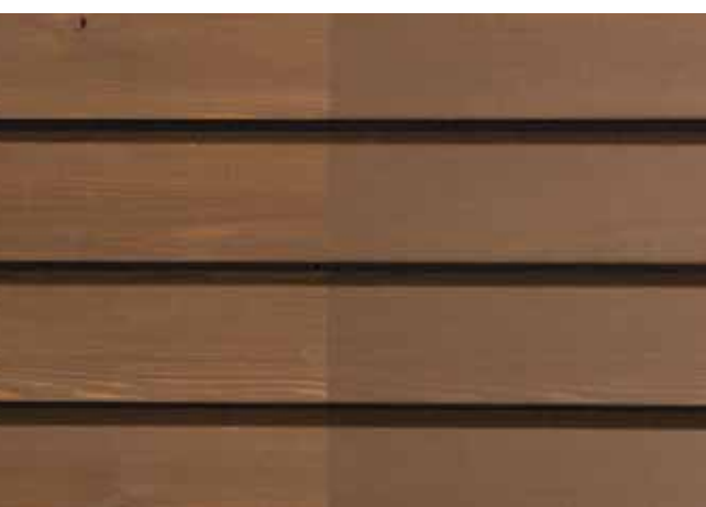
Teinte 4735-M (une couche)