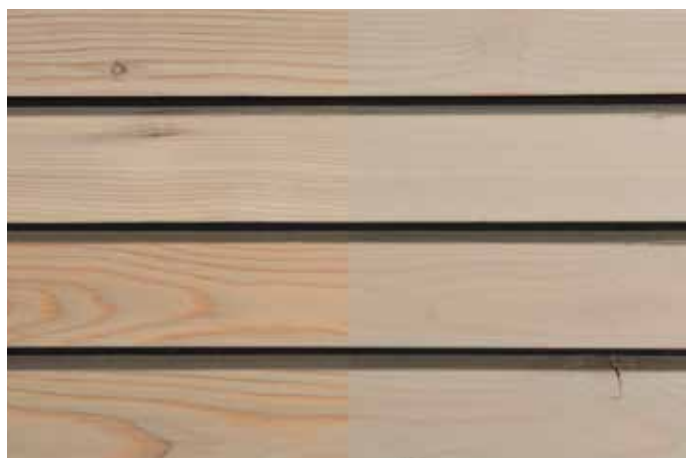
Teinte 4863 (une couche)