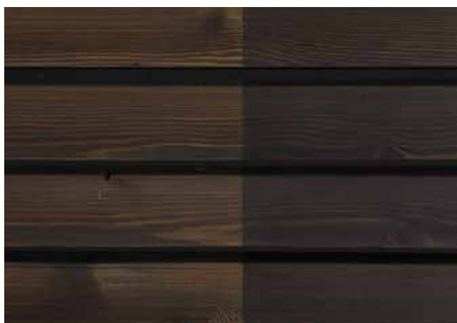
Teinte 4890 (une couche)