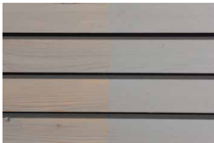
Teinte 4875-M (une couche)